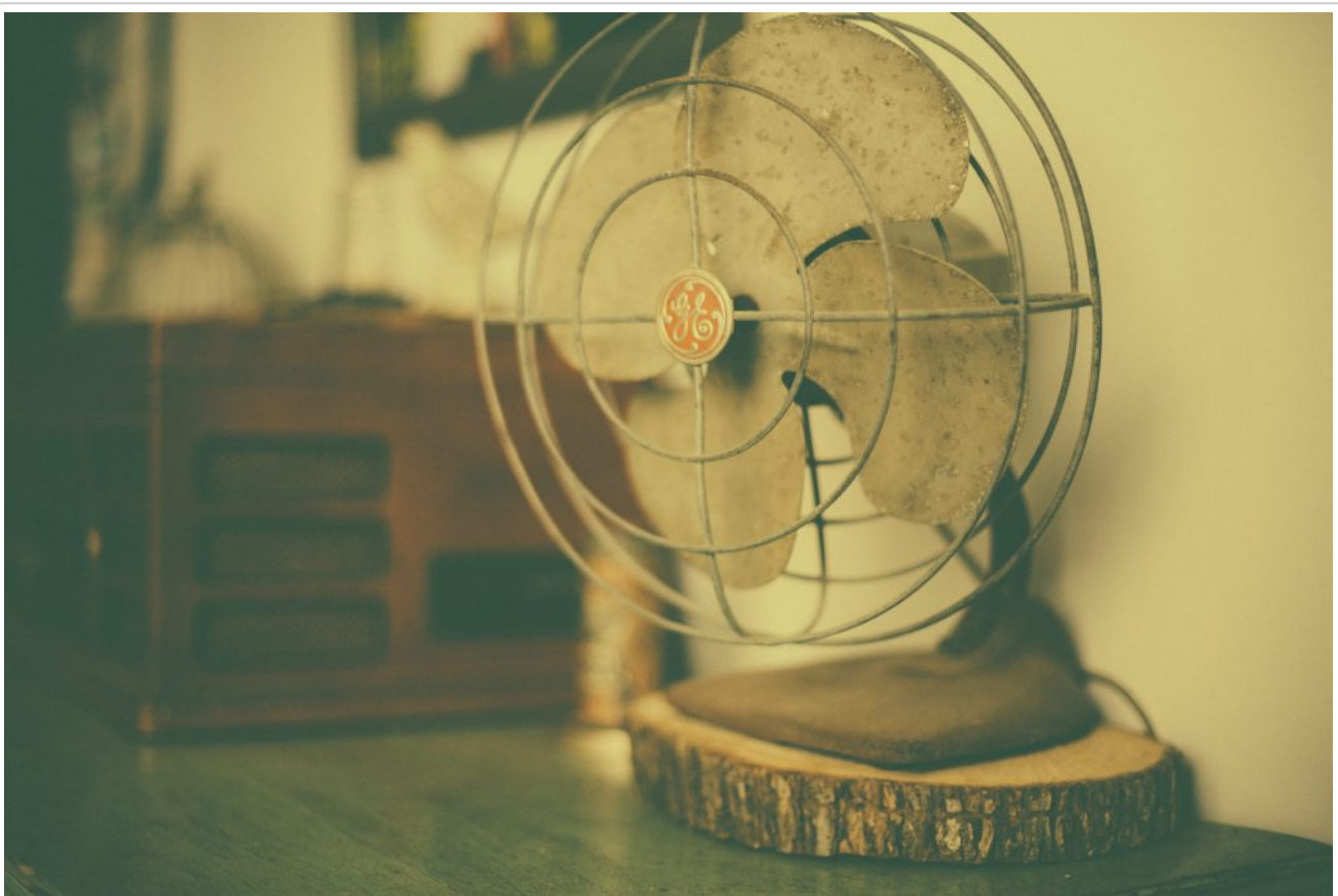
Mit Wind gegen Wespen.

Wenn man Nagetiere wie zum Beispiel Mäuse vertreiben möchte, hat das Gerät eventuell hierfür eine positive Wirkung.