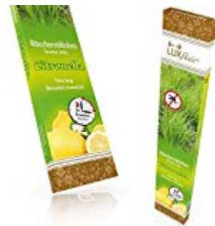
Garten-Räucherstäbchen | 3 Stunden Brenndauer | 20 Stück Angebot bei Amazon Angebote bei eBay