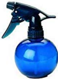
Efalock Sprühkugel | Blau Angebot bei Amazon Angebote bei eBay