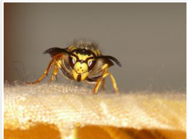
Die Deutsche Wespe ( Vespula germanica ) erkennt man an drei charakteristischen Punkten im Gesicht.

Haben Wespen einmal etwas Passendes zum Fressen gefunden, markieren sie es mit Duftstoffen, die auch Artgenossen darauf