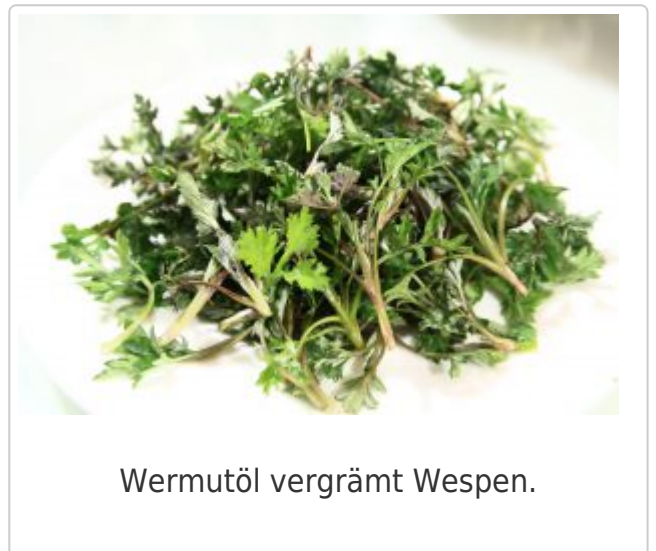
Wermutöl vergrämt Wespen.