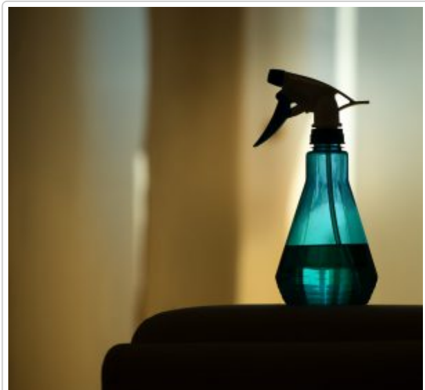
Wespen mit Wasser besprühen.

Der Kaffeerauch vertreibt dann mit Glück die Wespen vom Tisch. Dies funktioniert allerdings